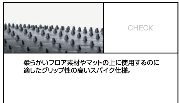
●裏面「スパイク」仕様